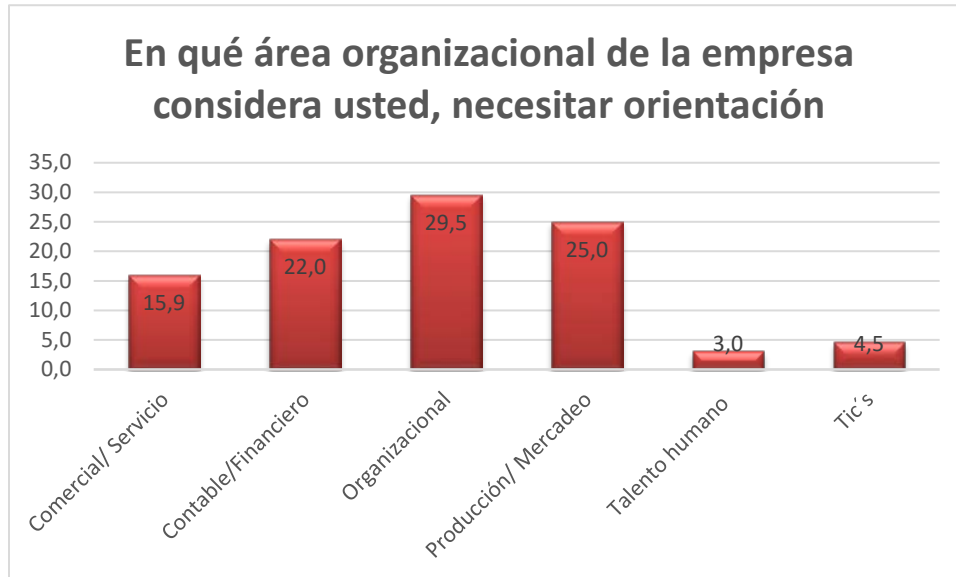
Figura 3. Área organizacional que necesita orientación

De las personas encuestadas 110, manifiestan tener identificado el mercado objetivo para su producto y/o servicio, de los cuales el 20% de la población total manifiesta tener el músculo financiero para emprender su idea de negocio y un 80% requiere análisis financiero para emprender su propuesta de negocio y solo un 63% conoce las diferentes fuentes de financiación existente en el país.