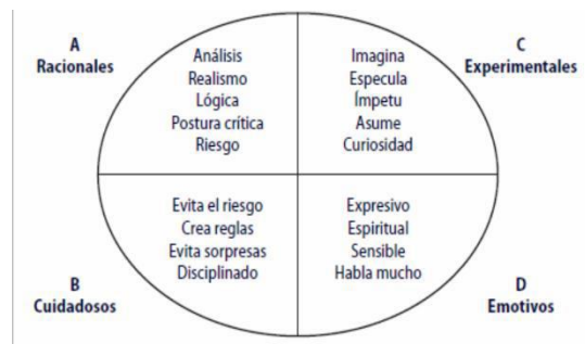
ESQUEMA 1. MODELO DE NED HERRMANN

* Tomado de Revista de Investigación Educativa, 2009